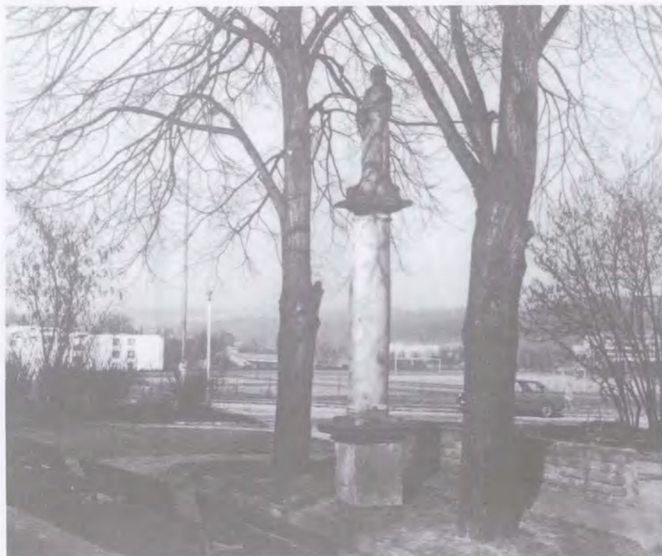
Sousoší se sv. Annou z roku 1889 na vysokém sloupu zdaleka vyznačovalo v rovinatém terenu křižovatku stezek. Nyní z nich zbyla jen krátká pěšina mezi bloky domů k jihu.

Heršpic. Snad z toho důvodu, že v té době byla tato oblast značně zamokřena a nehodila se ani k průchodu a tím méně k osídlení. K druhému posunu došlo při osídlení okolí brodu přes Svratku na Starém Brně asi v 10. století, soudě podle stáří rotundy z doby kolem r. 1000 v areálu starobrněnského kláštera (Květ, 1993). Teprve asi koncem 12. století při nedostatku místa na Starém Brně nastalo osídlování svahů pod Petrovem a Špilberkem. Je to jen zlomek času z dlouhé historie osídlení brněnské krajiny, co je centrum města ve svých nynějších polohách. Ale i „predispozice křižovatky“ nebyla během tohoto vývoje zcela opuštěna. Svědčí o tom např. románský kostel v Luhu (dnešním Komárově) z 12. století nepříliš vzdálený od místa křižovatky. Poloha křižovatky se také mohla během tisíciletí mírně posunovat především s ohledem na hydrografické podmínky na soutoku a větvení řeky Svratky a jejich přítoků Svitavy a Ponávky; také polohy brodů se mohly posunovat.