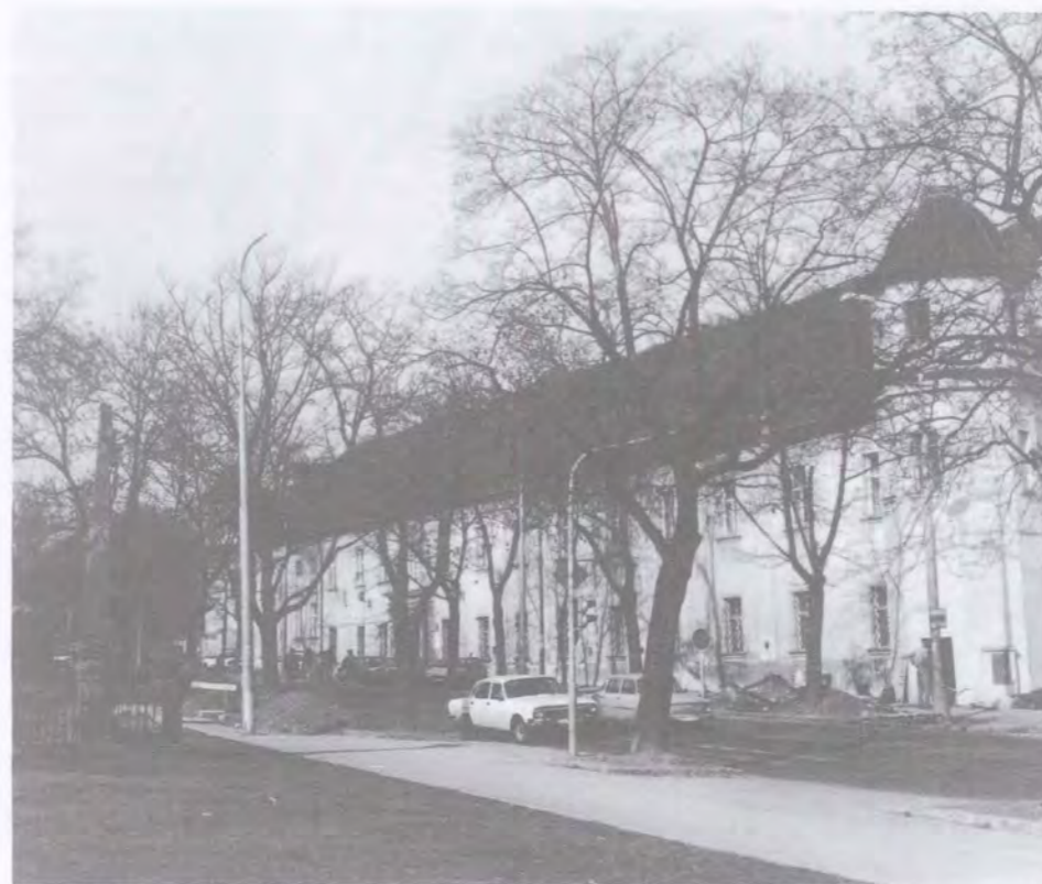
V Králově Poli na křižovatce stezek stojí kartouzský klášter a proti stezce od východu přibíhající je čelem k ní obrácen kříž rovněž vyznačující starou trasu.

území dnešního Brna je dána křižovatkou stezek, která svou polohou odpovídá přibližně území Horních Heršpic v jižní části města. Severojižní směr přímého průběhu je zvláště důležitý ve své jižní části: zde probíhal nejkratší spoj do Podunají do oblasti dnešní Vídně, resp. dále k jihu až k Jadranu. Směr k severu mohl vést posléze do Čech nebo ev. do polské nížiny. Východozápadní trasa je mírně obloukovitého průběhu. Její význam je v oblasti Brna násoben ještě vidlicovým rozbíháním stezek na východní i západní straně (tj. ve směru do vyškovské brány a k JV k soutoku Dyje s Moravou a kromě toho ještě do míst dnešního Hodonína, na západní straně pak rozdělení vede k SZ do Polabí a k JZ přes území dálkového spojení horního Povislí (dnešní Krakov) se středním a horním Podunajím (dnešní Linec), tedy východní Evropy (ev. Asie) s jihozápadní Evropou, event. jižní Evropy (Jadranu) se severní Evropou (Baltem). Toto dálkové spojení představuje také jednu z predispozic trasy tzv. jantarové stezky Moravou. Tak se už z dávné minulosti předznamenává význam této křižovatky pro možnost osídlení jako obchodního centra.