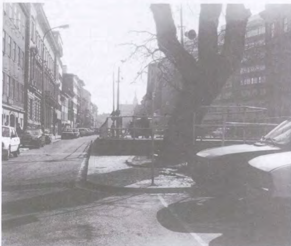
Po stezce zůstala stopa ve snížené úrovni odštěpující se silničky před vstupem do parku Lužánek na Lidické ulici. Před asi dvěma desetiletími zde ještě stával kříž chráněný stromem dosud stojícím. Kříž vyznačoval starou stezku.

území dnešního Brna je dána křižovatkou stezek, která svou polohou odpovídá přibližně území Horních Heršpic v jižní části města. Severojižní směr přímého průběhu je zvláště důležitý ve své jižní části: zde probíhal nejkratší spoj do Podunají do oblasti dnešní Vídně, resp. dále k jihu až k Jadranu. Směr k severu mohl vést posléze do Čech nebo ev. do polské nížiny. Východozápadní trasa je mírně obloukovitého průběhu. Její význam je v oblasti Brna násoben ještě vidlicovým rozbíháním stezek na východní i západní straně (tj. ve směru do vyškovské brány a k JV k soutoku Dyje s Moravou a kromě toho ještě do míst dnešního Hodonína, na západní straně pak rozdělení vede k SZ do Polabí a k JZ přes území dálkového spojení horního Povislí (dnešní Krakov) se středním a horním Podunajím (dnešní Linec), tedy východní Evropy (ev. Asie) s jihozápadní Evropou, event. jižní Evropy (Jadranu) se severní Evropou (Baltem). Toto dálkové spojení představuje také jednu z predispozic trasy tzv. jantarové stezky Moravou. Tak se už z dávné minulosti předznamenává význam této křižovatky pro možnost osídlení jako obchodního centra.